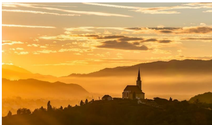
Cerkev Matere Božje na Gorci v Malečniku